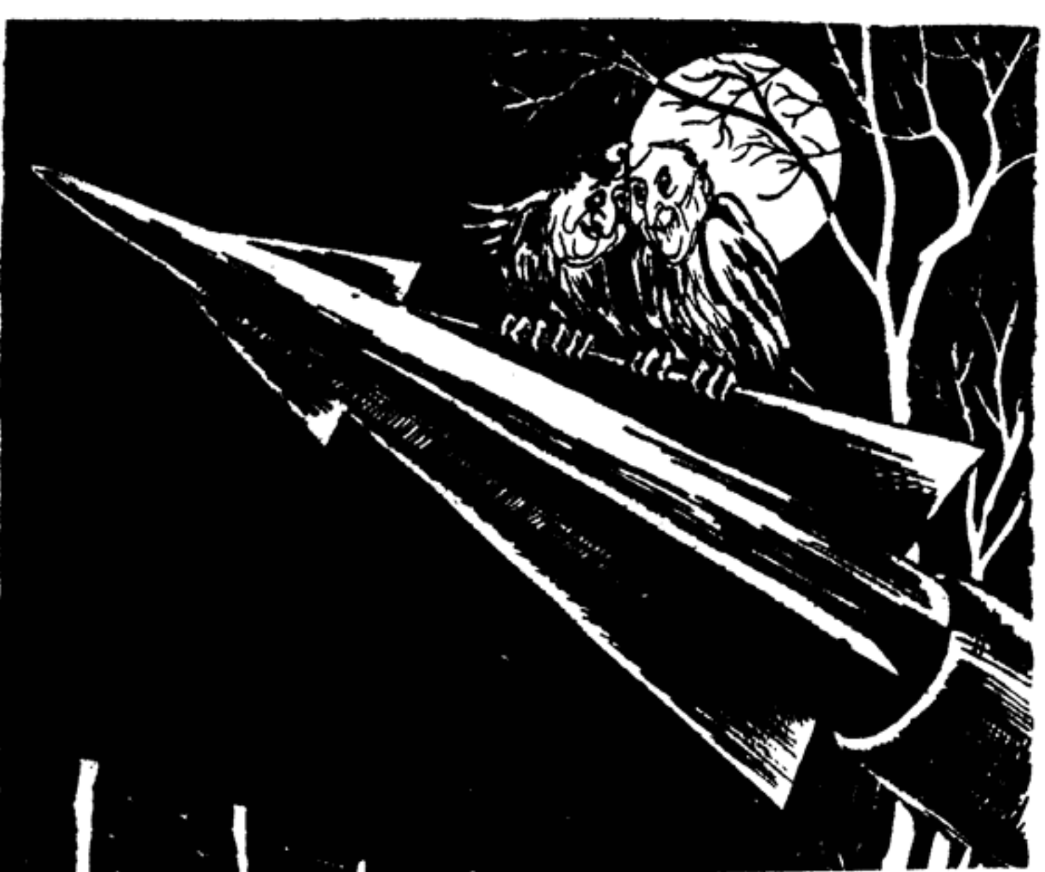
— Надо было повременить с разглашением тайны нашей помолвки, пока мы не свили гнездышко и не снесли яичко.