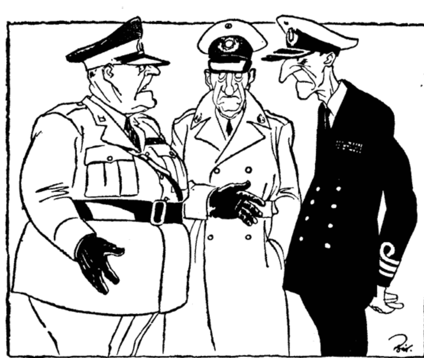
— Советский Союз уготовил нам судьбу хуже смерти — стать штатским!