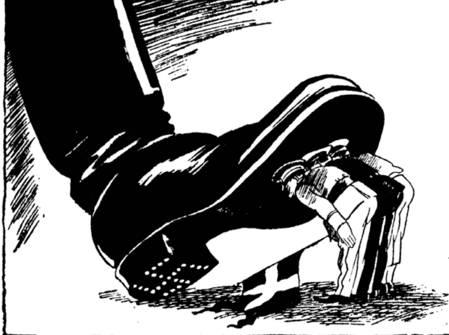
— А с помощью вот этого белый сверхчеловек сможет решить расовую проблему в Америке.

Среди высшего датского офицеровства есть люди, приветствующие возрождение западногерманского вермахта.